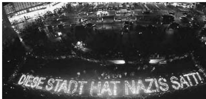
Das Gedenken an die Bombardierung wird als Aktion im „Kampf gegen Rechts“ inszeniert - so etwas sieht die bürgerliche Öffentlichkeit in Dresden gern. (2005)

Dabei werden nicht nur die Opfer des Nationalsozialismus benutzt, um sich letztlich mit ihnen in eine Reihe zu stellen. Es wird daraus abgeleitet jetzt auch den eigenen „ deutschen Opfern “ gedenken zu dürfen. Damit wird der historische Kontext wiederum verwischt und die Täterschaft der Deutschen verschwindet im europäischen „ Jahrhundert der Kriege und der Gewalt “.